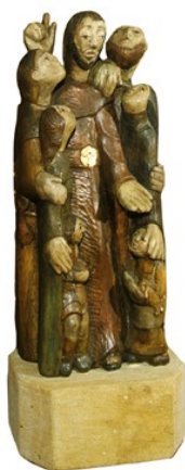
Emmausstatue am Eingang zur Kapelle

Immer ist dieser dritte Tag, da uns beim Brotbrechen die Augen aufgehen und wir dich erkennen und brennenden Herzens gestehen: Du lebst unter uns, Herr! Halleluja!